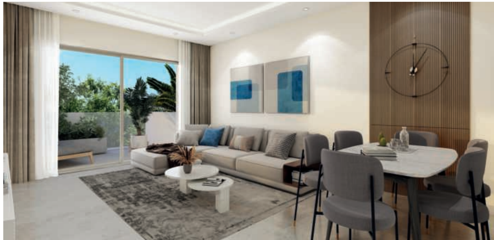
Visuels décoratifs fournis à titre indicatif